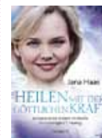
Jana Haas Heilen mit der göttlichen Kraft 232 Seiten, € (D) 17,99 Trinity Verlag